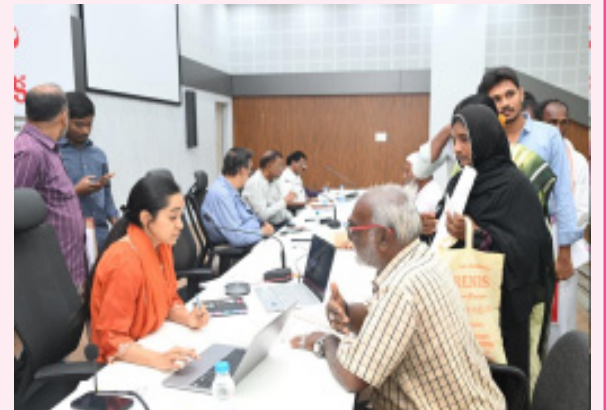
చెందేలా అర్జీలను పరిష్కరించాలన్నారు. ఎందర్నీ ఇచ్చిన అర్జీలకు జిల్లా అధికారులు ఖచ్చితంగా పరిశీలించాలన్నారు.

వైఎస్ ఆర్ కడప, ఫిబ్రవరి 16 (భారత శక్తి): ప్రజా సమస్యల పరిష్కార వేదిక కార్యక్రమం ద్వారా స్వీకరించిన అర్జీలను ప్రత్యేక శ్రద్ధతో పరిష్కరించాలని